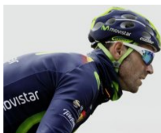
Alejandro Valverde visera le doublé dans les classiques ardennaises.

Vainqueur à trois reprises à Liège (2006, 2008, 2015), le Murcian de la Movistar (35 ans) connaît par cœur la classique belge qu'il a déjà courue à dix reprises. Seul bémol: si les conditions climatiques étaient déplorables, le vainqueur sortant prendra-t-il le moindre risque dans la perspec-