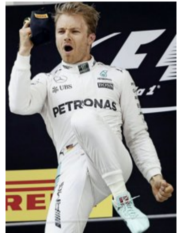
Rien ne résiste à Nico Rosberg cette année.

Kvyat, auteur d'un dépassement osé au départ, qui a provoqué un accrochage entre Vettel et son coéquipier Kimi Räikkönen, a signé son deuxième podium en F1. Il a aussi confirmé le renouveau de l'écurie autrichienne, démontré par la 4 e place de Daniel Ricci-